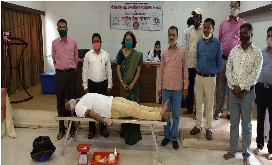
रक्तदान शिबिरात पाहणी करताना प्राचार्य, प्राध्यापक व स्वयंसेवक