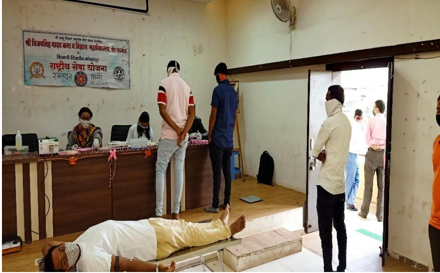
रक्तदान शिबिरात नोंदणी करताना स्वयंसेवक