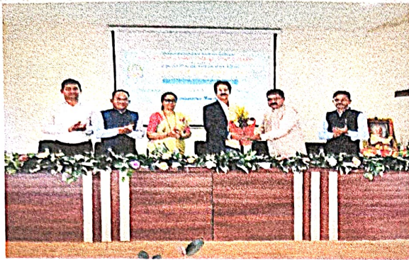
Felicitation of Chief Guest