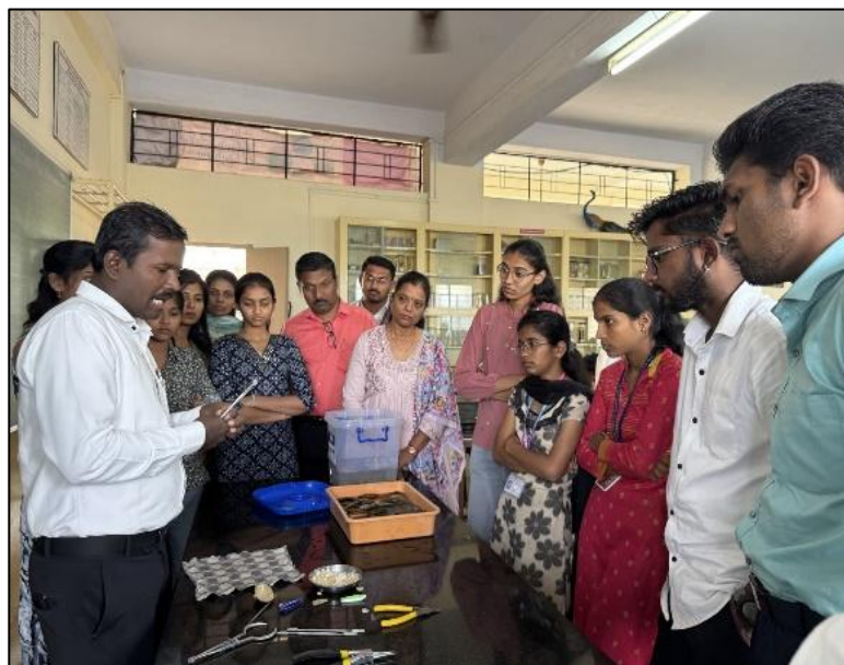
Hands on Training